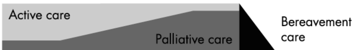
Figuur 2. Palliatieve zorg bij hartfalen (Gibbs 2005)

In het verloop van een levensbedreigende ziekte komt er meestal een moment waarop besloten wordt om de behandeling van de ziekte te staken. Bij patiënten met eindstadium hartfalen wordt vaak tot kort voor het overlijden doorggegaan met medicamenteuze ziektegerichte behandeling ('active care'), omdat dat bijdraagt aan de kwaliteit van leven (zie figuur 2 Palliatieve zorg bij hartfalen (Gibbs 2005) en bijlage 1g.Symptoomgerichte behandeling en omgang met hartfalenmedicatie ) [Gibbs 2002, Hupcey 2009, Jaarsma 2009]. Pas in de stervensfasefase wordt ziektegerichte hartfalenbehandeling gestaakt. De behandelingen die meer gericht zijn op verlenging van het leven en voorkomen van plotselinge hartdood, bijvoorbeeld cholesterolverlagende middelen of een ICD device, worden meestal eerder gestaakt c.q. gedeactiveerd.