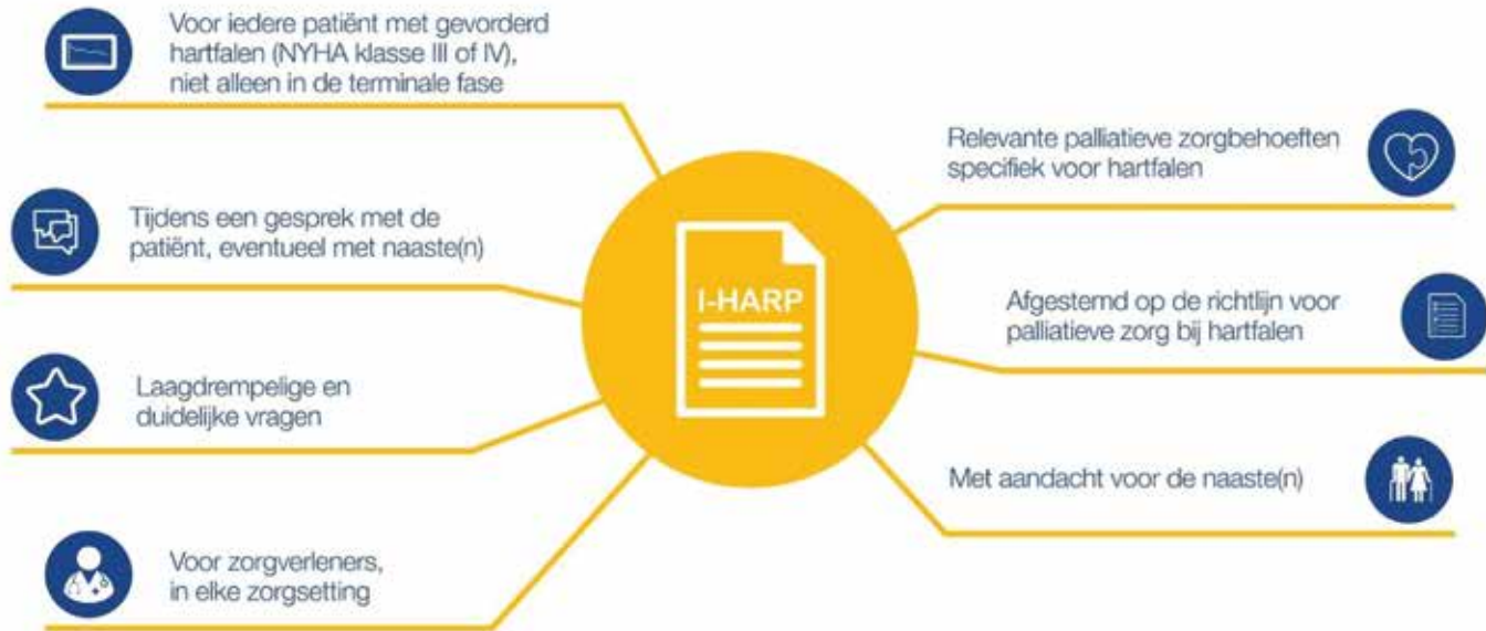
Afbeelding 1. Wat is het hulpmiddel I-HARP?

I-HARP helpt bij tijdig herkennen van palliatieve zorgbehoeften bij hartfalen en richting geven aan palliatieve zorg Patiënten met gevorderd hartfalen hebben belangrijke palliatieve zorgbehoeften. Juist het tijdig signaleren van palliatieve zorgbehoeften en het bieden van de juiste zorg kan lijden voorkomen en verlichten. I-HARP is een hulpmiddel voor zorgverleners om palliatieve zorgbehoeften bij patiënten met gevorderd hartfalen te signaleren en richting te geven aan de zorg.