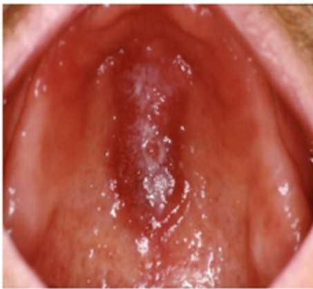
Chronische hyperplastische candidose

De chronisch hyperplastische vorm komt voornamelijk voor aan de binnenkant van de mondhoeken, de tongrug en het gehemelte (zie foto). Het uit zich in witte, verheven, wrachtige slijmvliesveranderingen. Het is niet geheel duidelijk of deze vorm wel primair een candidose is of eerder een leukoplakie met een secundaire infectie met Candida albicans . Bij deze vorm van candidose dient men eerder alert te zijn op maligniteiten. Het is dus belangrijk onderscheid te maken tussen leukoplakie en een candidose. Leukoplakie veroorzaakt meestal geen symptomen, maar de plekken kunnen soms gevoelig zijn voor warme of gekruide voedingsmiddelen. Een candidose kan gepaard gaan met symptomen zoals pijn, branderigheid, gevoeligheid, een slechte smaak in de mond en moeite met slikken. Als er twijfel bestaat over de diagnose, kan een tandarts of medisch specialist een biopsie uitvoeren om leukoplakie te bevestigen of als diagnose te verwerpen, terwijl een schraapsel van de laesies kan helpen bij de diagnose van een candida-infectie. Wanneer wenselijk is het mogelijk om professioneel medisch advies in te winnen bij een kaakchirurg voor een juiste diagnose en behandeling