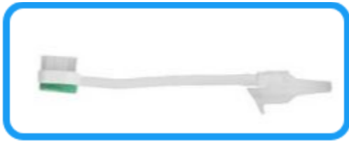
Afbeelding: Borstel voor tracheacanule

Daarnaast is het van belang om mogelijke pijnklachten in de mond- en keelholte en xerostomie adequaat te behandelen, aangezien deze pijn de voedselinname kan belemmeren. Lokale anaesthetica, pijnstillende mondspoelingen en medicatie kunnen worden overwogen als aanvullende maatregelen om pijn te verlichten en het slikken te vergemakkelijken (zie ook module Pijn in de mond ).