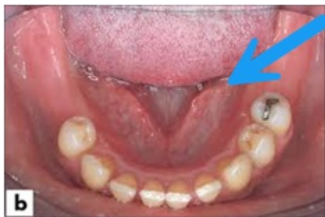
'Plasje' van speeksel

Bij een normale speekselsecretie ontstaat onder in de mond bij de speekselklieruitgangen een 'plasje' van speeksel (zie foto).