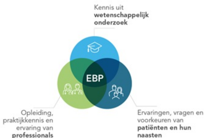
Figuur 1 Elementen Evidence Based Practice

Naast evidence uit wetenschappelijk onderzoek is ook de ervaring van de zorgverleners en de unieke situatie van patiënt en diens naasten essentieel voor het werken volgens de principes van Evidence Based Practice (EBP, zie figuur 1). Een uitgebreide beschrijving van de methode waarop deze richtlijn is ontwikkeld, is te vinden in bijlage Methode .