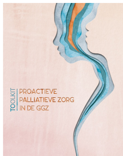
Toolkit Proactieve Palliatieve Zorg.