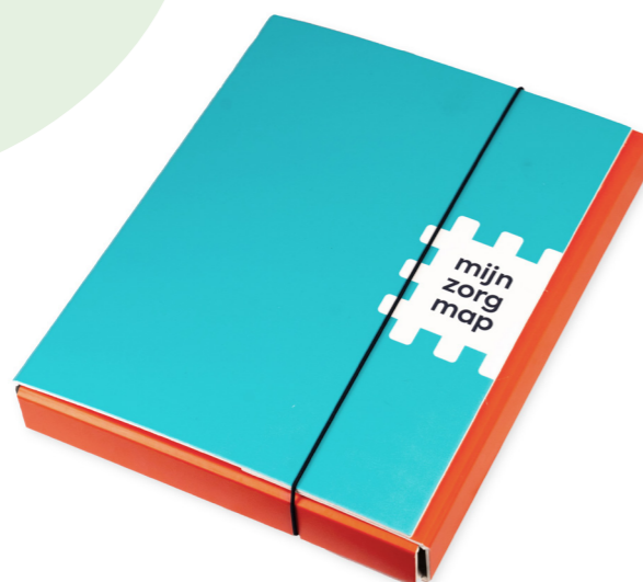
Zorgmap Netwerken Palliatieve Zorg Fryslân.

Eerder werd het PZP bewaard in de thuiszorgmap. Deze map bestaat