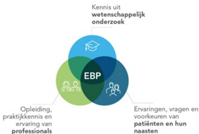
Figuur 1 Elementen Evidence Based Practice

Naast evidence uit wetenschappelijk onderzoek is ook de ervaring van de zorgverleners en de unieke situatie van patiënt en diens naasten essentieel voor het werken volgens de principes van Evidence Based Practice (EBP, zie figuur 1). Een uitgebreide beschrijving van de methode waarop deze richtlijn is ontwikkeld, is te vinden in bijlage Methode .