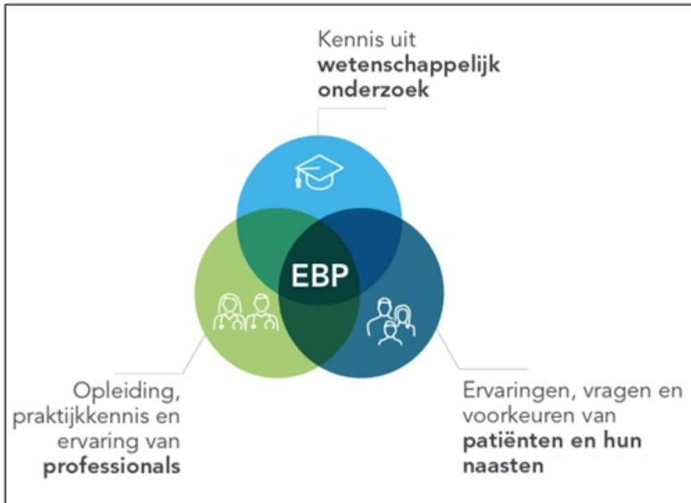
Figuur 2 Elementen Evidence Based Practice

Ter voorbereiding op deze handreiking is in 2021 onder zorgprofessionals geïnventariseerd welke interventies relevant zijn om in deze handreiking aan bod te laten komen. De werkgroep heeft op basis van een knelpunteninventarisatie door middel van interviews onder patiënten en naasten gekozen voor de volgende interventies voor respectievelijk kinderen en volwassenen in de palliatieve fase.