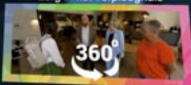
Zorg in de laatste fase

De zorgbehoefte van bewoners in het verpleeghuis richt zich op palliatieve zorg. Als je kijkt naar de bewoners in het verpleeghuis, zie je vaak ongeneeslijk ziek of hebben ze een bepaalde kwetsbaarheid. Daardoor is de behandeling die ze krijgen niet meer gericht op genezen maar op comfort en kwaliteit van leven. Bij welke bewoners zie je een behoefte aan palliatieve zorg? En hoe ziet die zorg precies uit in de verschillende fasen van palliatieve zorg?