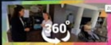
Zorg in het verpleeghuis

In de thuiszorg help en ondersteun je cliënten die door ziekte hun leven niet meer kunnen leven zoals eerst. Ze kunnen hulp krijgen bij het huishouden, de persoonlijke verzorging of medische/verpleegkundige zorg. Soms is er dan al behoefte aan bepaalde ondersteuning van het hele zorgteam vraagt. Maar gezamenlijke inspanning van het hele zorgteam vraagt. Maar waar moet je dan op letten? En wat houdt die palliatieve zorg dan precies in? Vooral in deze fase van het leven?