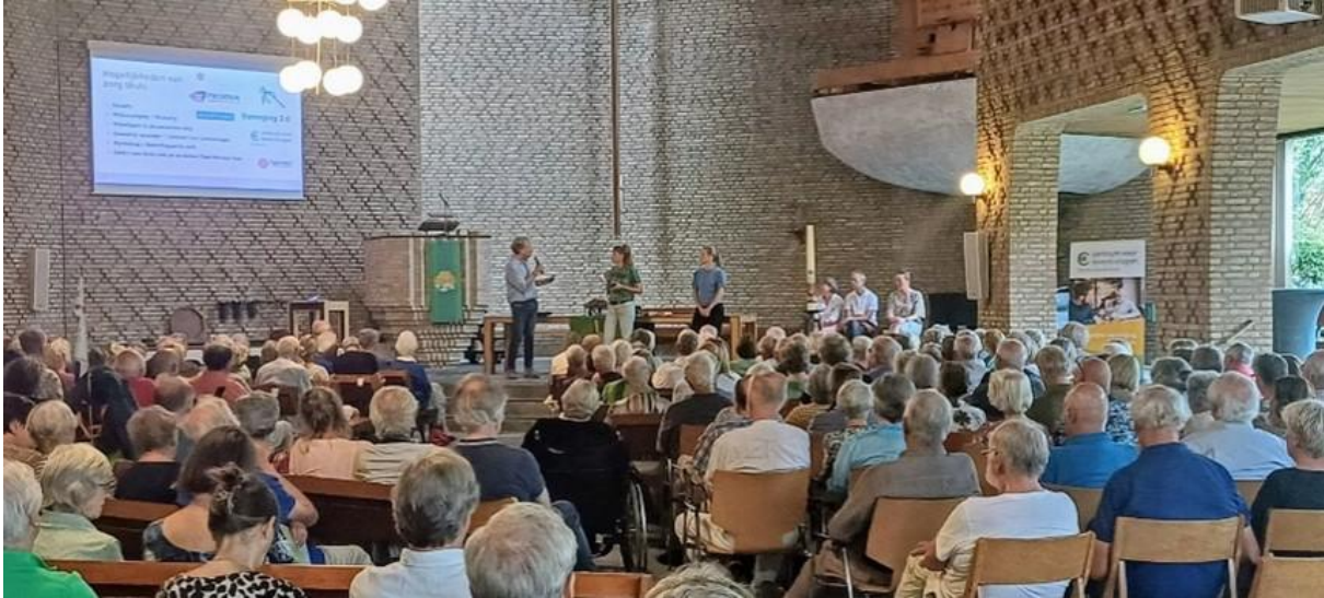
Weet u wat u wilt-bijeenkomst in Amersfoort, september 2024