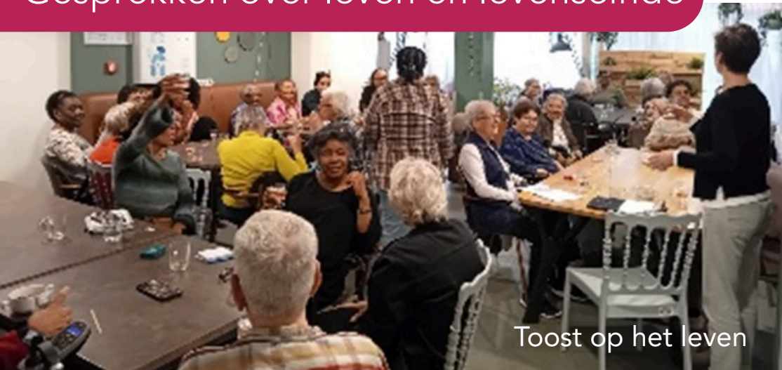
Toost op het leven

Amsterdam UMC ontving in 2026 een onderwijsinnovatieprijs voor Serious Gamechangers in het palliatieve zorgonderwijs. De NPZA is hierbij betrokken door het faciliteren van betekenisvolle gesprekken tussen geneeskundestudenten en inwoners, onder de titel Toost op het Leven!