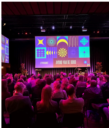
Avond van de dood: 350 bezoekers