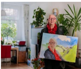
Toolkit campagne palliatieve zorg