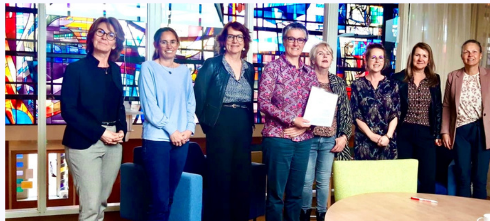
Afbeelding: leden van de projectgroep Transmurale Consultatie