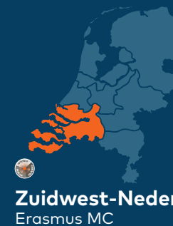
Zuidwest-Nederland Erasmus MC