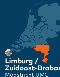
Limburg / Zuidoost-Brabant Maastricht UMC