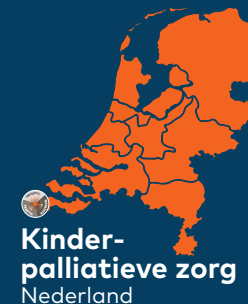
Kinder-palliatieve zorg Nederland