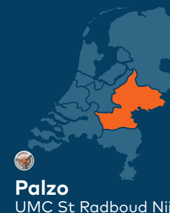
Palzo UMC St Radboud Nijmegen