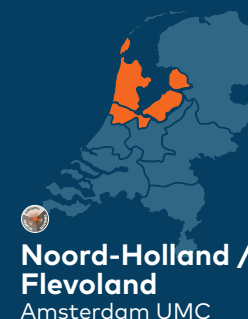
Noord-Holland / Flevoland Amsterdam UMC

Voor meer informatie over het Landelijk Onderwijsknooppunt palliatieve zorg én de acht regionale Onderwijsknooppunten palliatieve zorg, zie: www.palliaweb.nl/onderwijs/onderwijsknooppunten