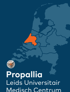
Propallia Leids Universitair Medisch Centrum