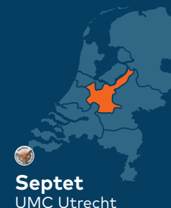
Septet UMC Utrecht