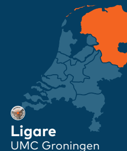
Ligare UMC Groningen