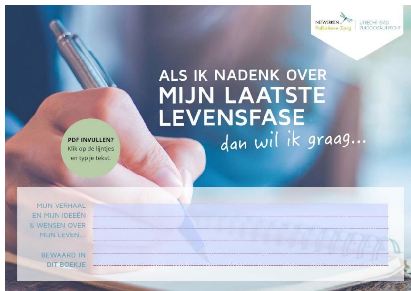
Wensenboekje voor de laatste levensfase