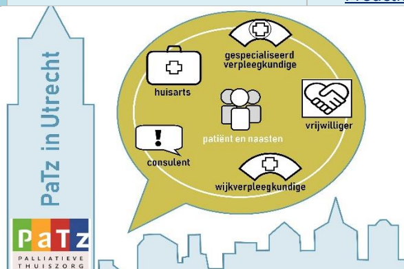
Logo van PaTz in Utrecht