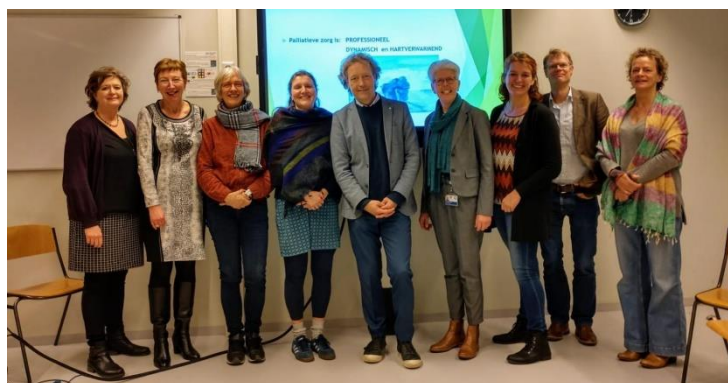
Leden van het onderwijsknooppunt van Septet met gasten Januari 2020