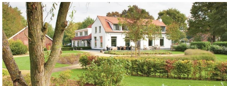
Hospice Demeter in De Bilt

Voornaamste knelpunten in de afgelopen twee jaar waren de uitval van professionals en vrijwilligers door covid, extra kosten door covid-maatregelen en een sterk wisselend aantal aanmeldingen.